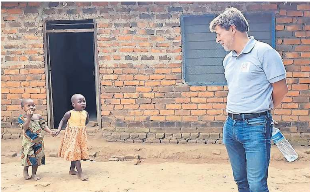
'Tanzania-Toine': „Wat hebben die mensen hier een hulp nodig.“